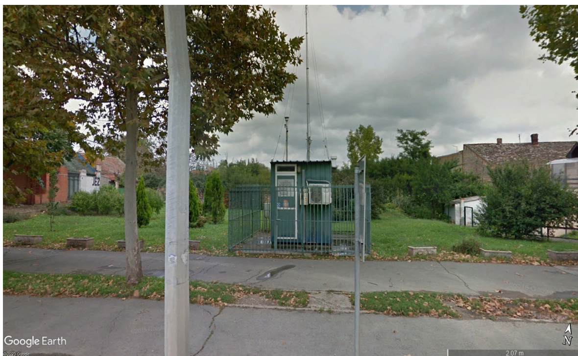
Mikrolokacija merne stanice „ZRENJANIN SAOBRAĆAJNA“